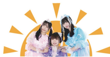
今年は私たち pacchi がバスガイドをつとめます!

各会場に設置した参加シートにスタンプを集めて、 先着で素敵な景品をGET! 4個全てのスタンプを集めた方には抽選で各社から お礼の品が!?